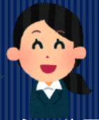
ソーシャルワーカー